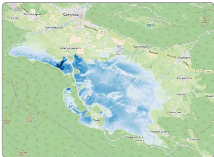
Carte de fréquentation du lac intermittent de Cerknica, dans le sud de la Slovénie, entre l'automne 2014 et le début de l'année 2018.

hydrologiques actuelles et passées, il fournit d'autres informations, parfois inattendues, comme par exemple, sur l'humidité résiduelle détectée après l'arrosage ou l'épandage sur des surfaces agricoles ou encore sur l'humidité de terrains de golf fréquemment arrosés, etc. La fonction la plus précieuse du portail reste la surveillance et l'évaluation des inondations de grande ampleur et l'observation de l'état des zones humides. Il permet de surveiller le niveau de l'eau pour des usages auprès des centrales hydroélectriques ou des exploitations agricoles. De plus, il peut être utilisé pour déterminer le degré de sécheresse du sol de grandes zones agricoles. Jusqu'à présent, le service de WhereIsWater.at n'a couvert que la Slovénie et quelques régions voisines mais il peut être étendu à d'autres zones où les conditions hydrologiques ne sont pas suivies régulièrement. Des professionnels de différents secteurs peuvent tirer avantage de l'utilisation de ces services pour répondre à leurs besoins spécifiques. L'Agence slovène de l'environnement utilise ce portail pour analyser le système hydrologique (eaux permanentes, lacs, aquifères), ainsi que pour prévoir le débit des cours d'eau. Sur la base d'images satellitaires, ce portail peut valider ou rejeter des alertes du système de prévision d'inondations. Enfin, il contribue notablement à l'accroissement des connaissances sur des zones géographiques reculées.